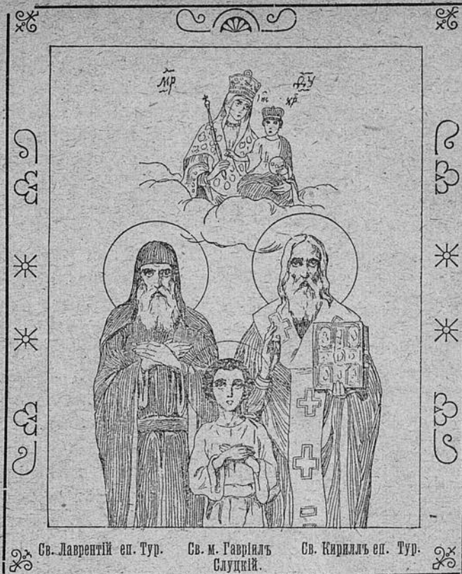
Св. Лаврентій еп. Тур.